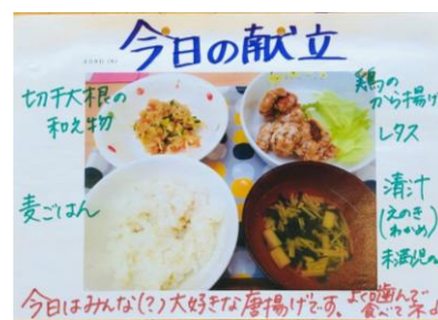
麦ごはん、唐揚げ、清汁、切干大根