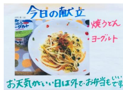
焼うどん、ヨーグルト