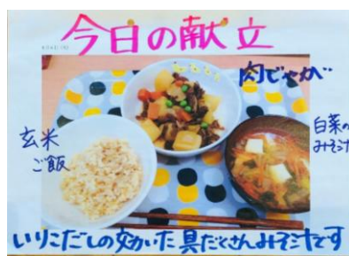
玄米ごはん、肉じゃが、白菜みそ汁