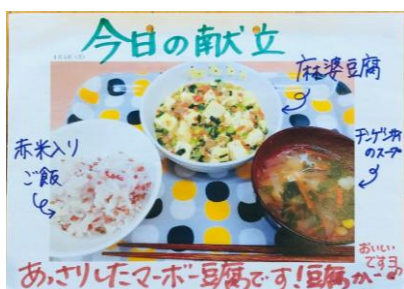
赤米ごはん、マーボ豆腐、チンゲン菜スープ

主食が毎日違います。赤米入り七分つきご飯、玄米、麦ごはん、黒米入り七分つきご飯、名店「サイラー」のロールパン、麺類など