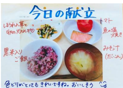
黒米ごはん、魚塩焼き、みそ汁