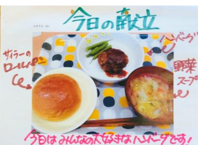
ロールパン、ハンバーグ、野菜スープ