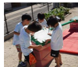
(年長 運動会 準備も自分たちで)